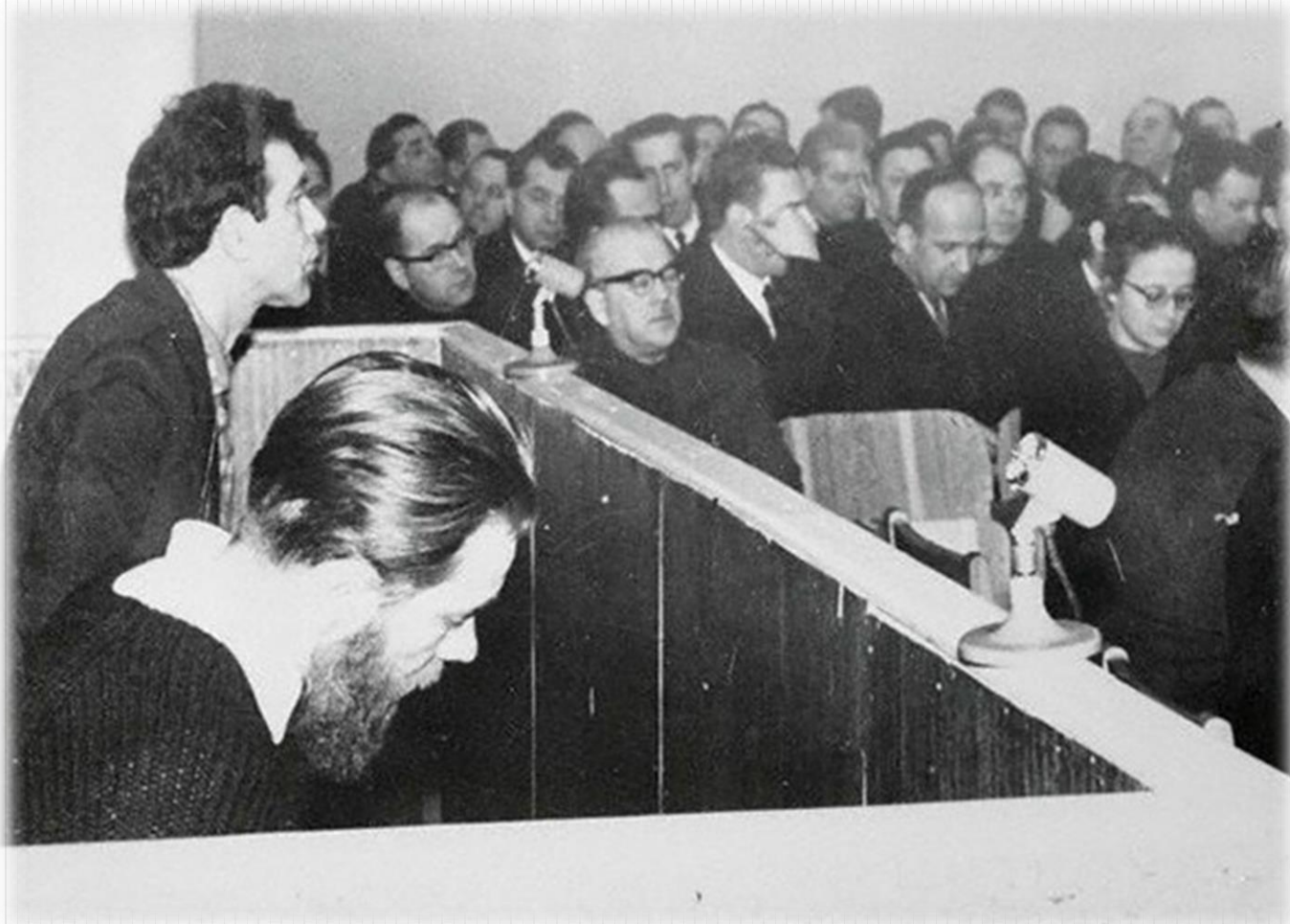
Ю. Даниэль и А. Синявский в зале суда