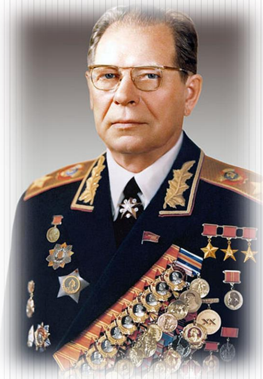
Д.Ф. Устинов – министр обороны СССР (1976 – 1984 гг.)