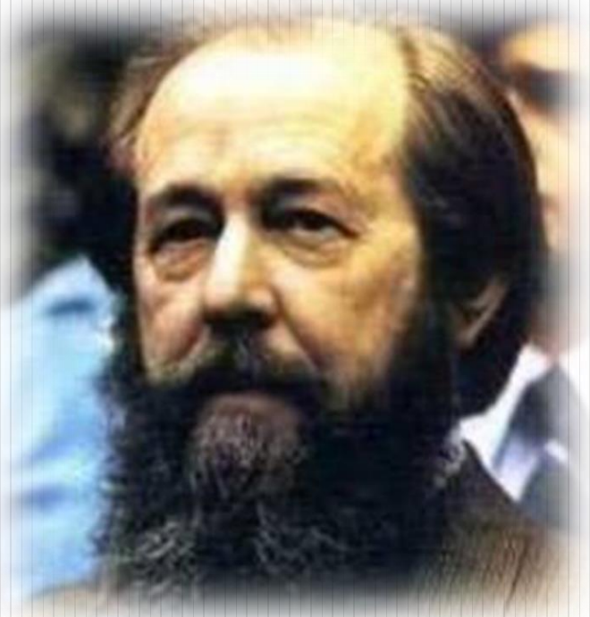
Александр Исаевич Солженицын (1918 – 2008 гг.)