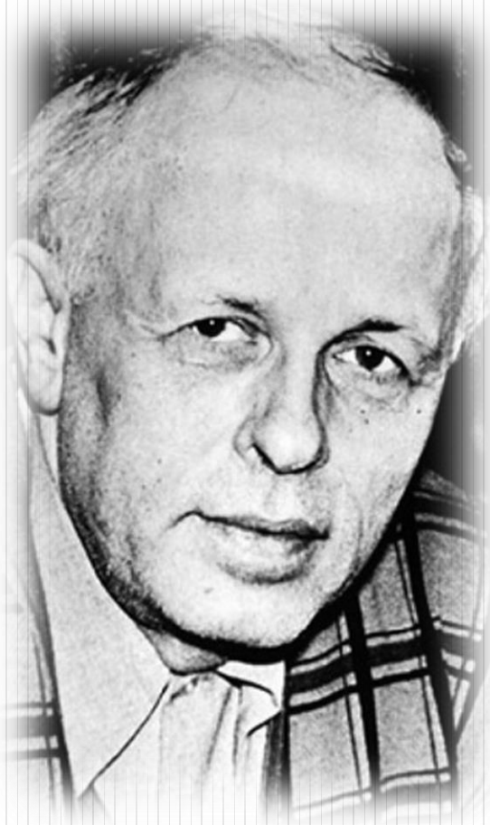
Андрей Дмитриевич Сахаров (1921 – 1989 гг.)