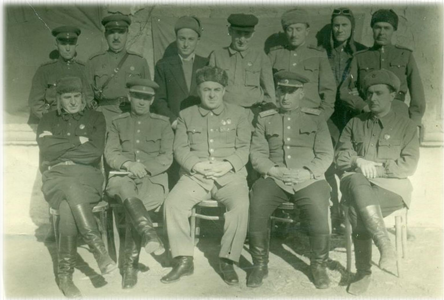
Делегация трудящихся Грузии в 18-й армии. Начальник политотдела 18-й армии Л. И. Брежнев в верхнем ряду, крайний справа.